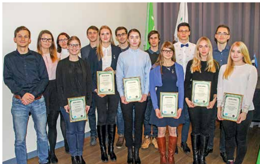
Teadusprojekti osalenud õpilased ja tudengid

Projekt sai alguse tudengite huvist ja soovist laiendada teadustööde tegemise võimalusi