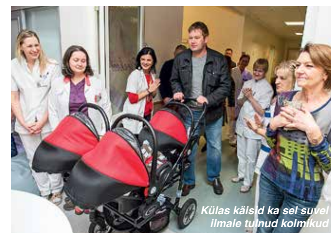
Külas käisid ka sel suvel ilmale tulnud kolmikud

“ Igal aastal sünnib Eestis ligi 800 last enne õiget aega. Tuua laps ilmale ennetähtaegselt, on emale ja perele emotsionaalne läbielamine.