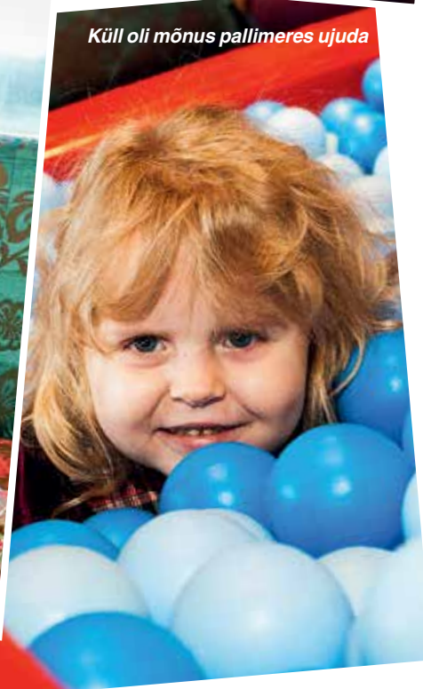
Küll oli mõnus pallimeres ujuda