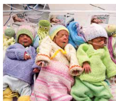
Novembris Keskhaigla Sünnitusmajas ilmale tulnud kolmikud

“ Tõenäoliselt sünnib tänava esmakordselt Keskhaigla Sünnitusmajas üle 100 paari kaksikuid.