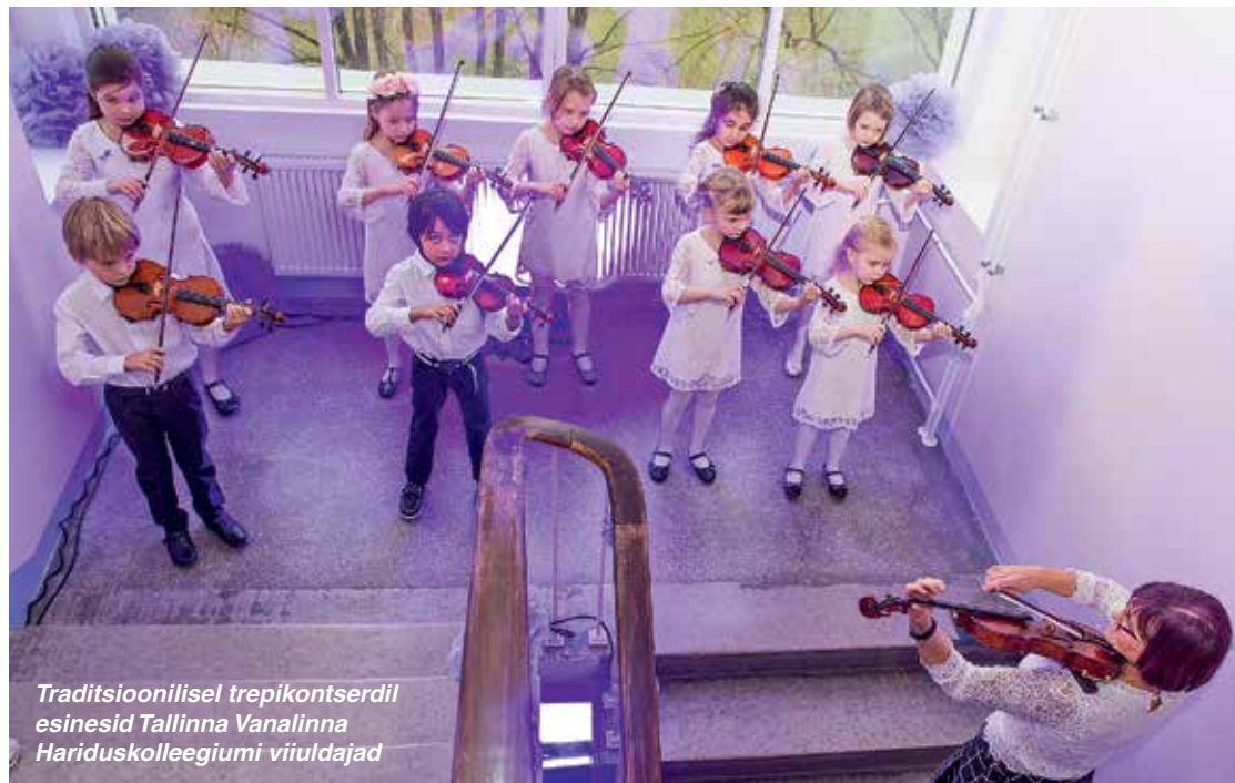
Traditsioonilisel trepikontserdil esinesid Tallinna Vanalinna Hariduskolleegiumi viiuldajad

Juba kolmandat aastat tegi Suhkruingel kõikidele keerulise sünnilooga ja enneaegselt sündinud beebide vanematele, kes viibisid sel päeval meie haiglas, ka magusa üllatuse.