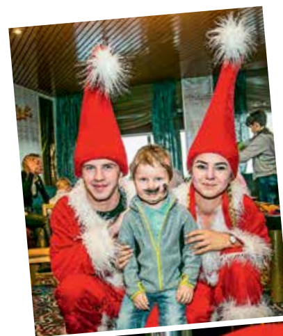
Jõuluvana saabudes koondusid kõik lapsed tema ümber