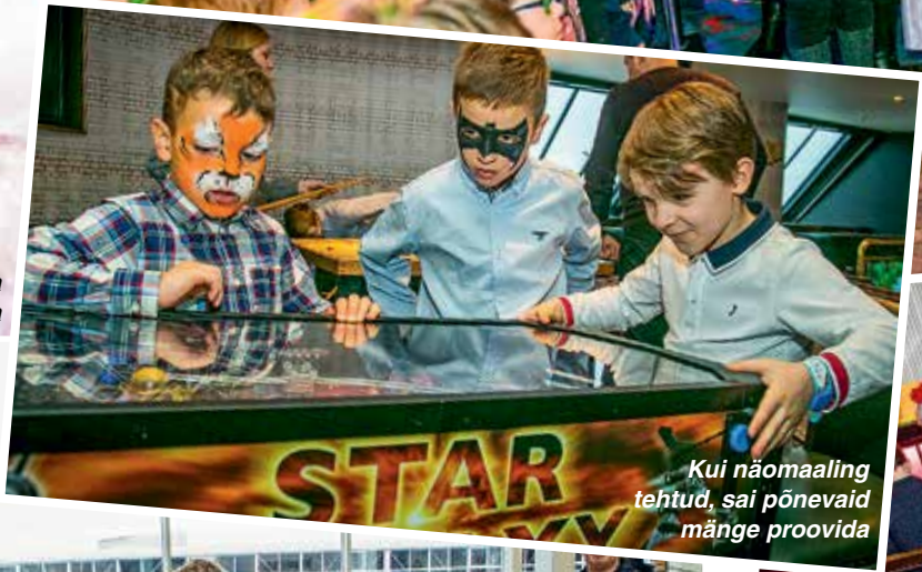
Kui näomaaling tehtud, sai põnevaid mänge proovida