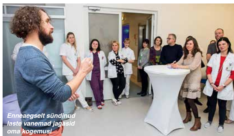
Enneaegselt sündinud laste vanemad jagasid oma kogemusi