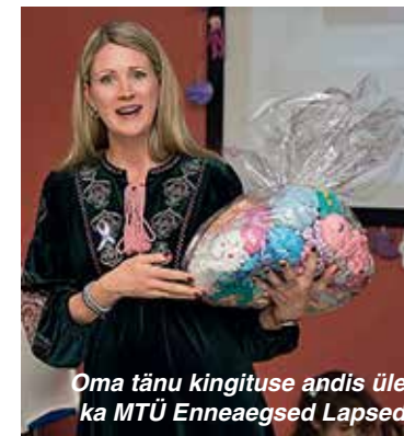
Oma tänu kingituse andis üle ka MTÜ Enneaegsed Lapsed