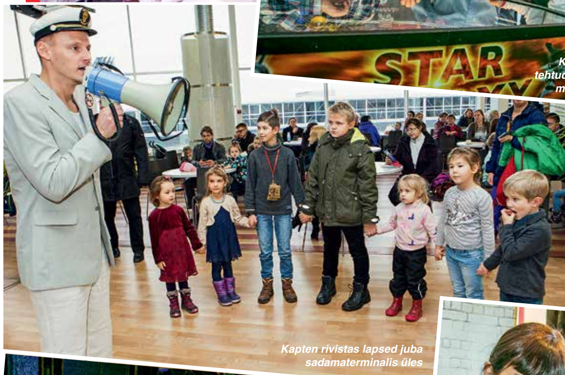
Kapten rivistas lapsed juba sadamaterminalis üles