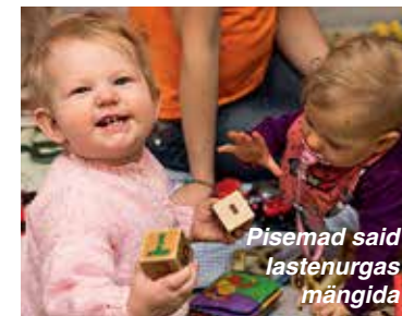
Pisemad said lastenurgas mängida