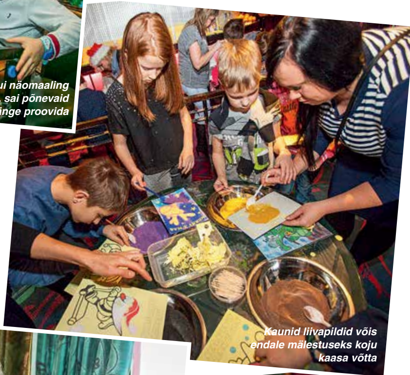
Kaunid liivapildid võis endale mälestuseks koju kaasa võtta