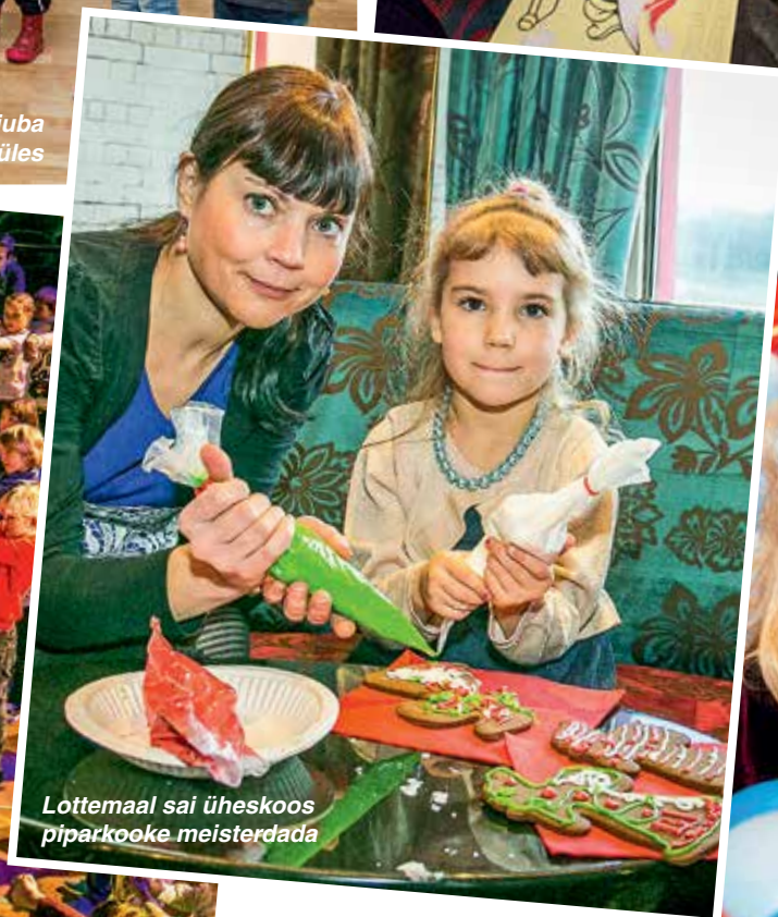
Lottemaal sai üheskoos piparkooke meisterdada