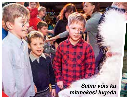
Salmi võis ka mitmekesi lugeda